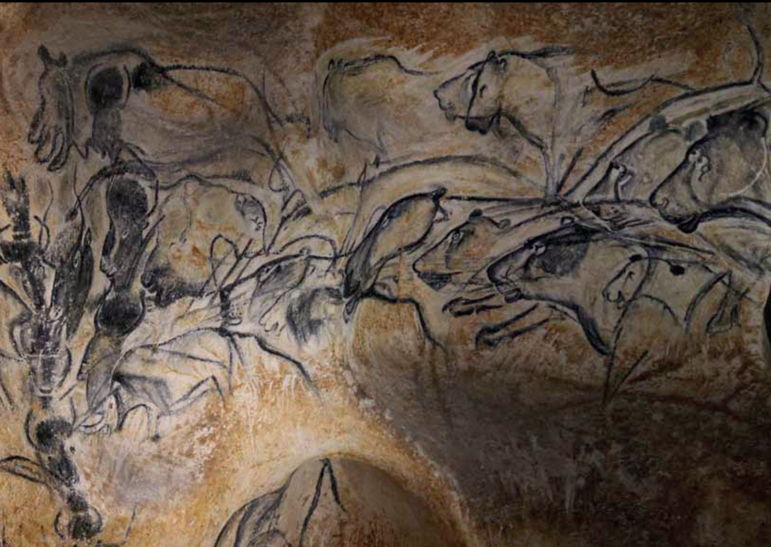
Poslikava v jami Chauvet v Franciji